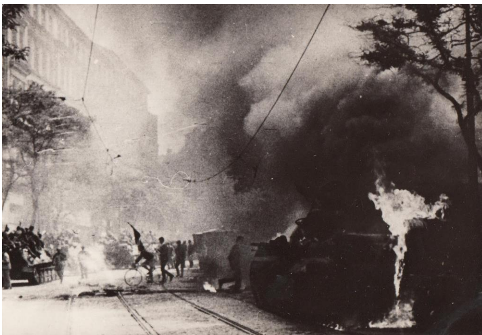
1968 okupace.