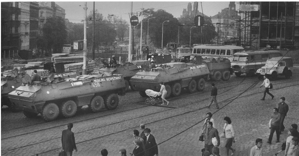
Obrněné transportéry VB zablokovaly pražské ulice, srpen 1969.