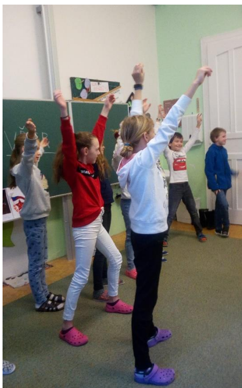
„Mužstvo v šatně po vyhraném zápase“