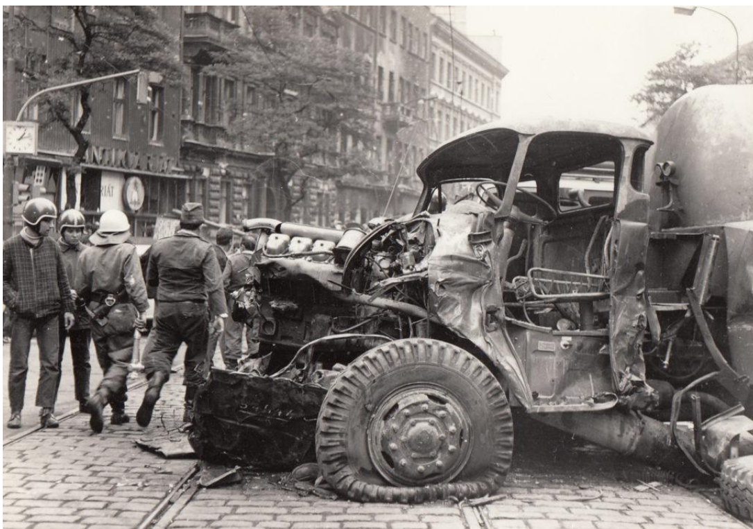
1968 okupace.